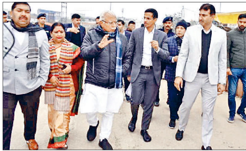
करनाल। एलिवेटेड फ्लाईओवर का निरीक्षण करते हुए केंद्रीय मंत्री मनोहर लाल।

केंद्रीय, ऊर्जा, आवासन एवं शहरी मामलों के मंत्री मनोहर लाल ने कहा कि करनाल शहर के बीचों-बीच बनने वाले एलिवेटेड फ्लाईओवर का निर्माण कार्य तेज गति से चल रहा है और आगामी दिसम्बर मास तक इसका निर्माण कार्य पूरा हो जाएगा। जैसे इस फ्लाईओवर का निर्माण कार्य पूरा होगा, इसका नाम पूर्व प्रधानमंत्री अटल बिहारी वाजपेयी को समर्पित करके अटल सेतु रखा जाएगा। यह घोषणा मनोहर लाल ने शनिवार को करनाल दौरे के दौरान शहर में चल रहे विभिन्न विकासवात्मक परियोजनाओं का निरीक्षण करने के उपरांत लोक निर्माण विभाग के विश्राम गृह में मीडिया से रूबरू होते हुए की। मनोहर लाल ने सर्वप्रथम मीडिया को नव वर्ष की शुभकामनाएं और हार्दिक बधाई दी। इस दौरान उन्होंने कहा कि नव वर्ष में नए संकल्प के साथ आगे बढ़ें देश व प्रदेश के विकास में सहयोगी बनें। उन्होंने मीडिया के सवाल के जवाब में कहा कि करनाल में आज उनका मुख्य कार्यक्रम विदेश में रोजगार के लिये चयनित युवाओं को ऑफर लेटर वितरण करना है। हरियाणा सरकार की यह एक अनूठी पहल है।