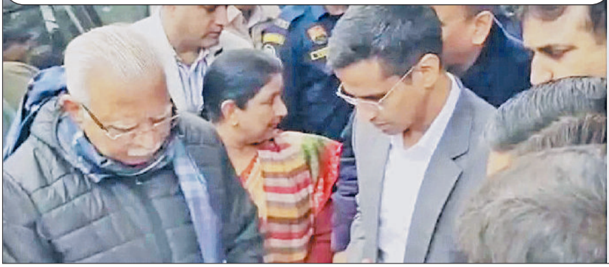
करनाल। मीडिया से बातचीत करते केंद्रीय मंत्री मनोहर लाल।