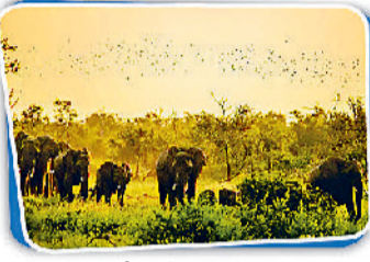
दक्षिण अफ्रीका में क्रुगर नेशनल पार्क

फिजी आकर्षक सांस्कृतिक विविधता का देश: अपनी मेहमाननवाजी, शुद्ध प्राकृतिक वातावरण और सांस्कृतिक विविधता के लिए मशहूर फिजी की यात्रा आपके लिए निश्चित तौर पर यादगार अनुभवों से भरी होगी। यहां के अदरुनी गांवों में खासतौर से मिलने वाले कावा (एक विशेष प्रकार का पेय) का स्वाद और अनुभव फिजी और वारे पर्यटक का पेय लेते हैं। कावा एक अनोखा पेय होने के साथ-साथ फिजी के समृद्ध सांस्कृतिक विरासत का प्रतीक-सा बन गया है। फिजी की यात्रा के लिए सबसे