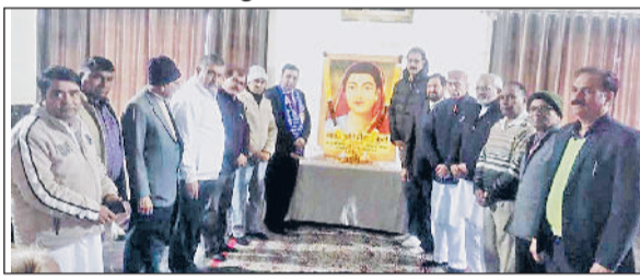
करनाल। फुले के जन्मदिन को महिला शिक्षा दिवस के रूप में मनाया।