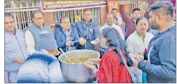
पानीपत। मां वैष्णो सेवा समिति के स्वयंसेवी भक्तजन भंडारे में प्रसाद बांटते हुए।