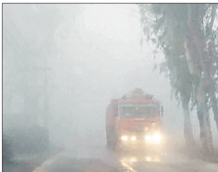
यमुनानगर। घना कोहरा छाए रहने से सड़कों पर लाइट जलाकर चलते हुए वाहन व टंड में बीमार हुए पशु को अलाव जलाकर ठंड से राहत देते हुए पशुपालक।