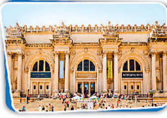
मेट्रोपोलिटन म्यूजियम ऑफ आर्ट