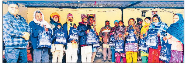
कुरुक्षेत्र। बूस्टर किट वितरित करते ट्रस्ट के सदस्य।