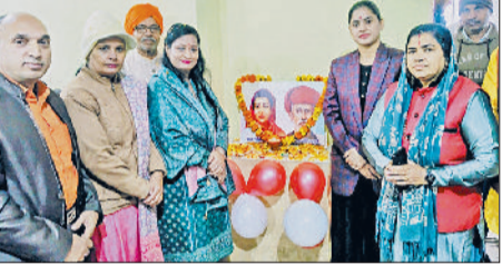
पानीपत। आईसीएस कोचिंग सेंटर में माता सावित्री बाई फुले को नमन करते हुए अतिथिगण।