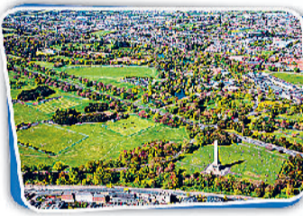
फिनिक्स पार्क डबलिन सिटी सेंटर

मास्टरप्लान का आनंद लेने के लिए खुले मैदान में बैठें, झील के पास ब्रेक लें, स्ट्रीटरी खेतों के पास रुकें जो जीन लेनन की याद में हैं या जाड़े में आइस स्केटिंग करें। जिन पर्यटकों को कला, प्रकृति और विज्ञान में दिलचस्पी है, वे मेट्रोपोलिटन म्यूजियम ऑफ आर्ट और अमेरिकन म्यूजियम ऑफ नैचुरल हिस्ट्री में जा सकते हैं, जो पार्क के बीच के हिस्से में ही स्थित हैं।