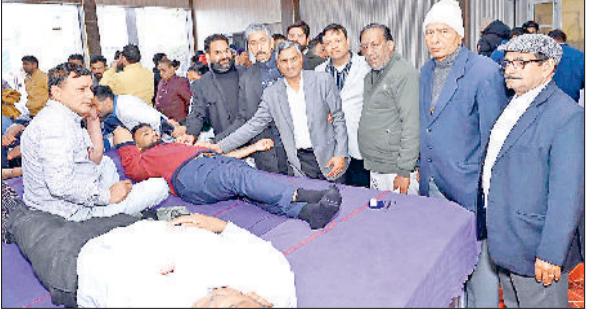
अंबाला। शिविर में रक्तदान करते युवा।