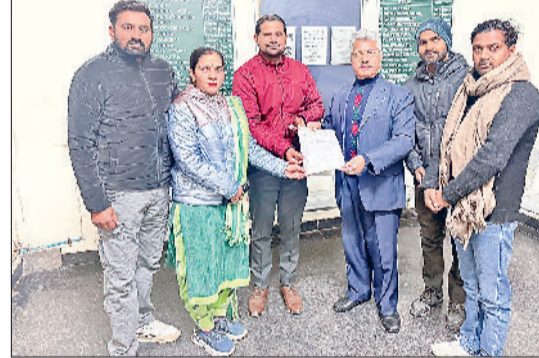
बराड़ा। डीईओ को ज्ञापन सौंपते हुए टीचर्स।