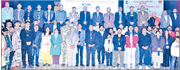
पानीपत। पानीपत रिफाइनरी में आयोजित नराकास की बैठक में उपस्थित चालीस विभागों के अधिकारी।

में पहुंच कर श्रद्धांजलि अर्पित करते हुए कहा कि भाजपा सरकार, पूर्व विधायक फतेहचंद विज के सपनों